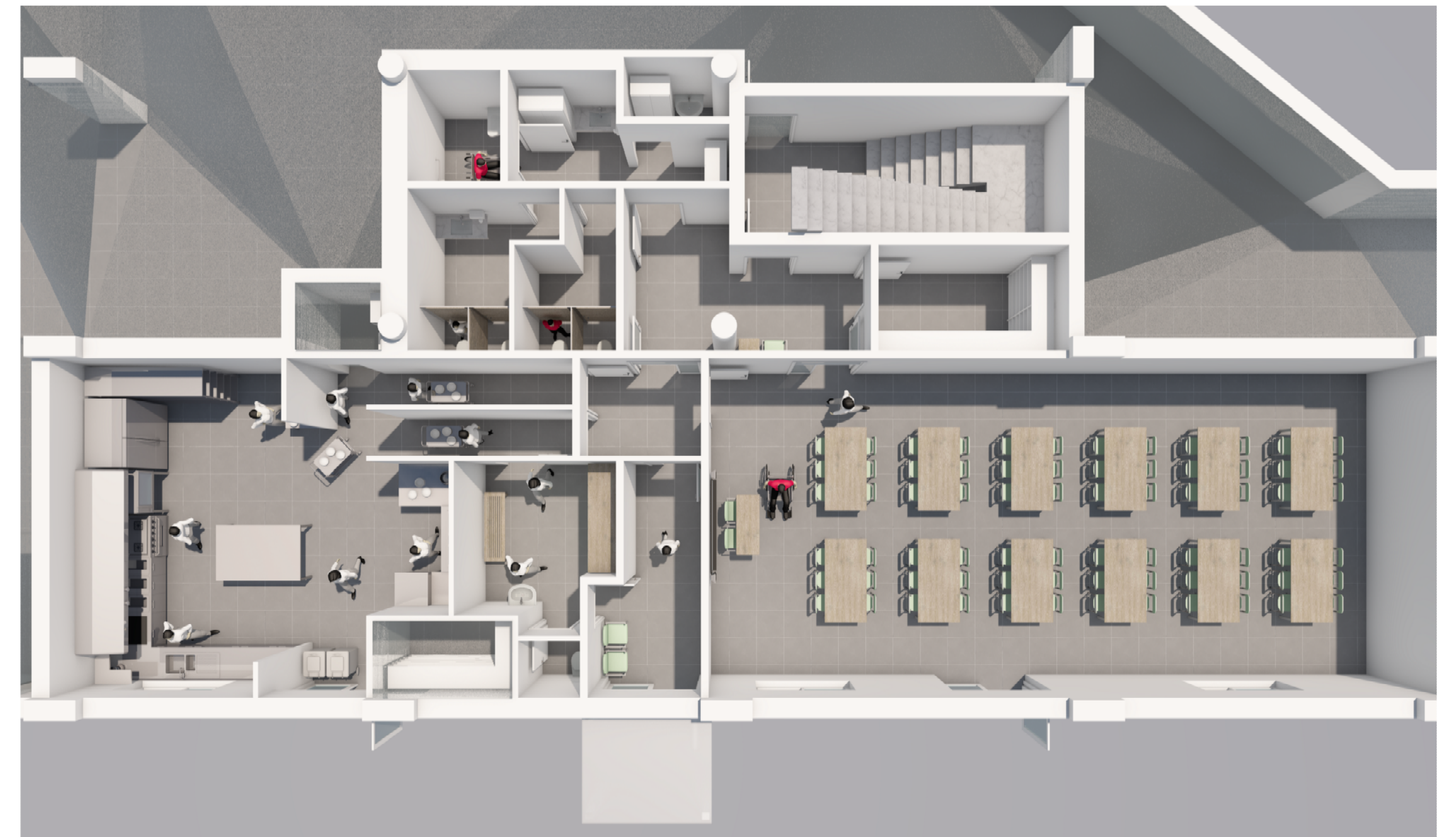
RENDER - 2