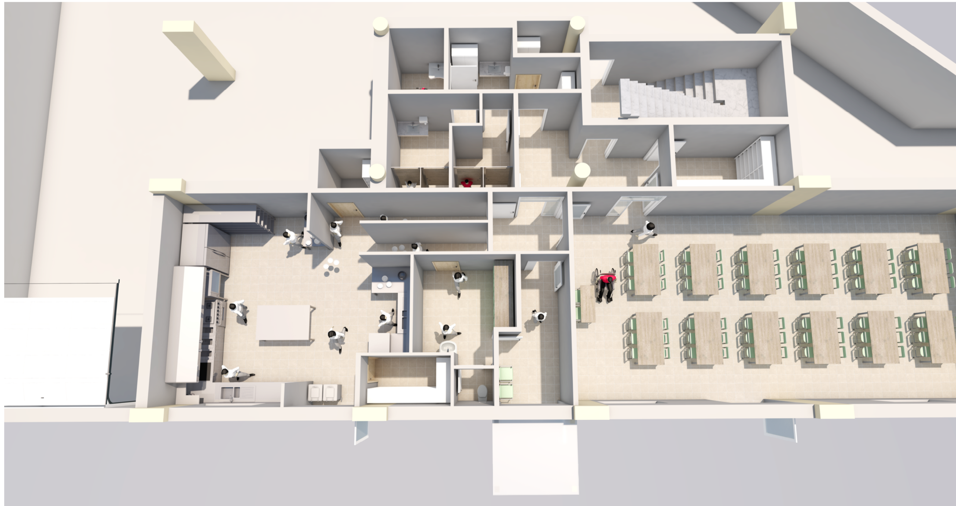
RENDER - 1